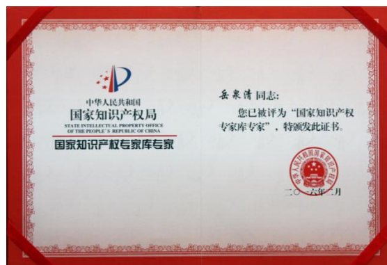
2016 年被国家知识产权局评为国家知识产权专家库专家